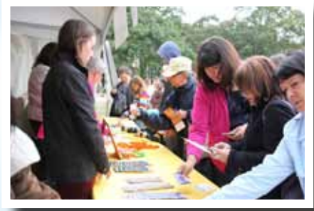
Le kiosque achalandé de la FEO au festival Word on the Street 2013, en septembre