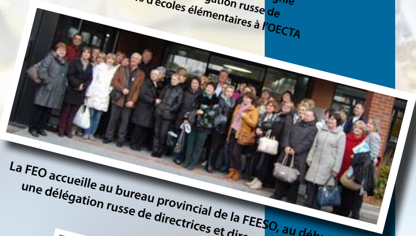
La FEO accueille au bureau provincial de la FEESO, au début de novembre, une délégation russe de directrices et directeurs d'écoles de Moscou