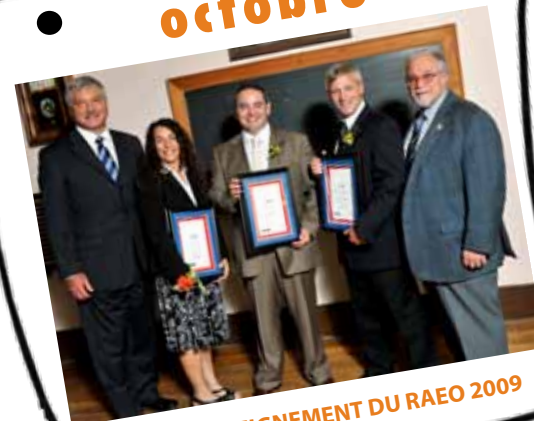
PRIX D'ENSEIGNEMENT DU RAO 2009