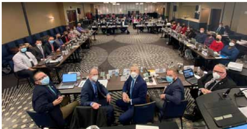
Réunion du Conseil d'administration de la FEO, printemps 2022. Première réunion en personne depuis janvier 2020.