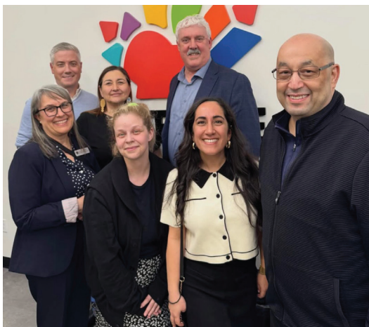
Le 14 avril 2026, la FCE a organisé une table ronde nationale en ligne intitulée La violence à l'école : À quand un vrai remède? La conversation a réuni des enseignantes et des enseignants ainsi que des membres de la direction de la fédération