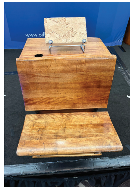
Bureau d'étudiant Globe Furniture, vers 1920

Un geste symbolique de ce changement a également eu lieu au début du Forum de cette année, lorsque la FEO a présenté au RREO un ancien pupitre d'élève en chêne et en fer forgé, qui appartenait à la FEO depuis des générations. Un rappel et un symbole de la mission qui unit toutes les personnes qui contribuent à la réalisation de la promesse de retraite.