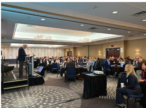
Le Pension Forum 2026

L'objectif était que les participantes et les participants repartent avec une meilleure compréhension de la complexité de gérer un régime de retraite dans un contexte mondial en rapide évolution et de la nécessité d'offrir des services de retraite exceptionnels à mesure que les besoins des membres évoluent. Les discussions sur les changements géopolitiques et l'incertitude économique ont retenu l'attention, tout en faisant passer un message clair : la protection des pensions des membres reste une priorité absolue. Toutes et tous ont clairement apprécié l'expertise et l'énergie des intervenantes et des intervenants, qui ont su approfondir et clarifier des sujets complexes.